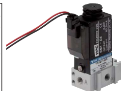
mit Rechteckstecker SY100

i Diese Ventile werden grundsätzlich mit Spule und Stecker ausgeliefert!