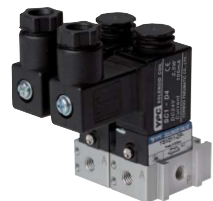
Beispiel verkettete Ventile

i Diese Ventile werden grundsätzlich mit Spule und Stecker ausgeliefert!