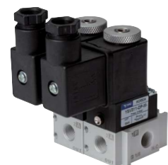
Beispiel verkettete Ventile

i Diese Ventile werden grundsätzlich mit Spule und Stecker ausgeliefert!